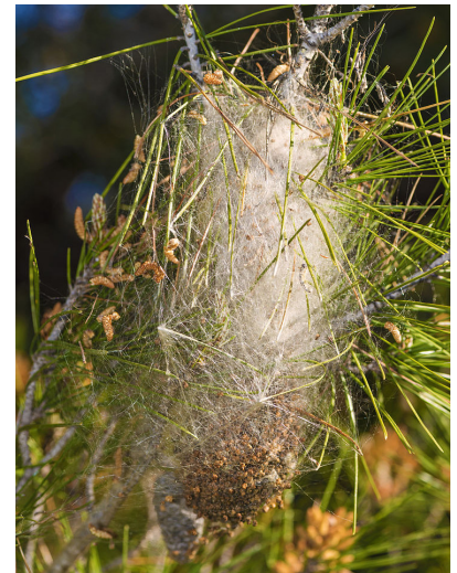
© Christian Ferrer - Wikimedia Commons / CC-BY-SA-4.0/ Thaumetopoea pityocampa